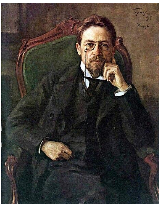
Художник О. Браз. Портрет А.П. Чехова. 1898.

В 2025 году у А.П. Чехова - очередной юбилей. Казалось, что нового можно сказать о его творчестве? За 120 лет, прошедшие со дня смерти писателя о его произведениях было написано в несколько раз больше, чем он сам написал за всю свою жизнь. Изучена биография, сформулированы особенности чеховского творчества. Общеизвестно, что медицинская тема в литературе никогда не проявляла себя так полно и разнообразно, как в произведениях А. П. Чехова.